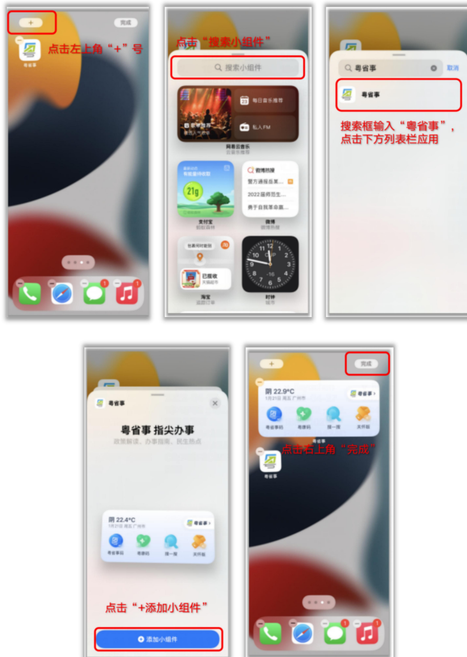
图 6：iOS 端添加桌面小组件操作步骤