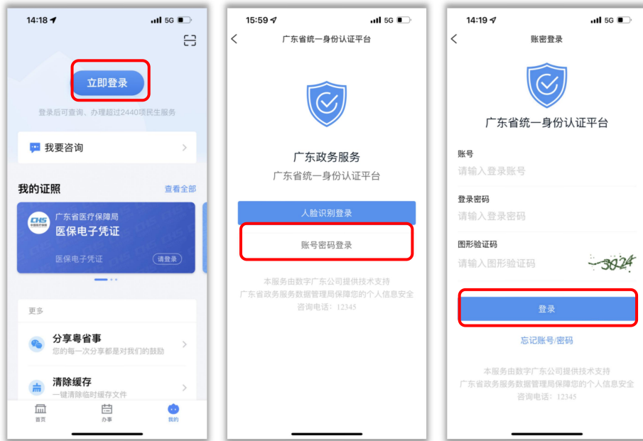
图 3：账号密码登录操作步骤