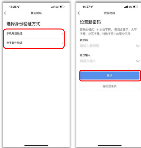
图 5: 找回密码操作步骤