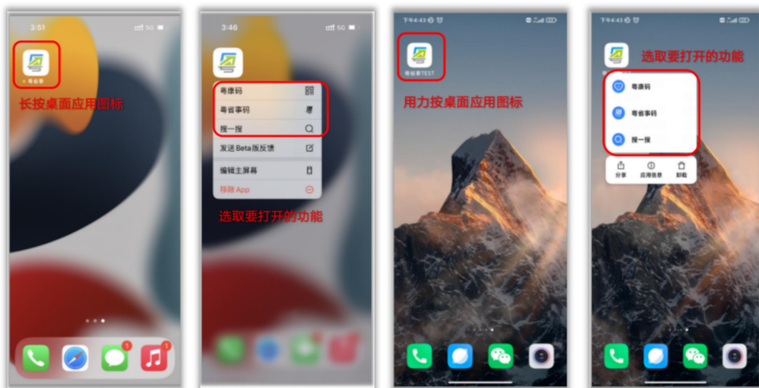
图 8：桌面图标快捷打开方式

iOS、安卓端操作方式一致，长按粤省事应用图标，将会弹出功能列表，根据用户需求快速触达所需服务。如需取消菜单栏，点击空白处即可。（如图8）