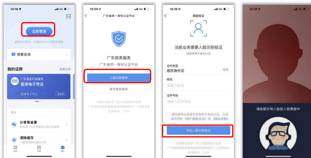
图 2：人脸识别登录操作步骤

成功下载安装，打开“粤省事”APP，点击导航栏【我的-立即登录-人脸识别登录】，输入身份信息，完成人脸识别即可完成登录。（如图 2）